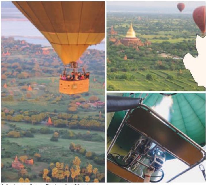
Ballonfahrten, Bagan – Ein einmaliges Erlebnis

Ein Land in dem die Zeit scheint stehen geblieben zu sein. Einzigartige kulturelle Schätze, eine liebenswerte Bevölkerung und unvergleichliche Landschaftsbilder prägen die tiefen Erlebnisse, die jeden Besucher zu faszinieren vermögen.