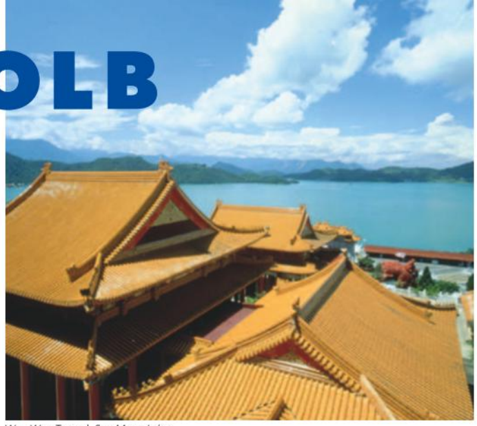
Wen Woo Tempel, Sun Moon Lake