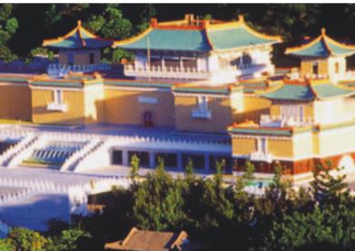
Das Nationale Palastmuseum