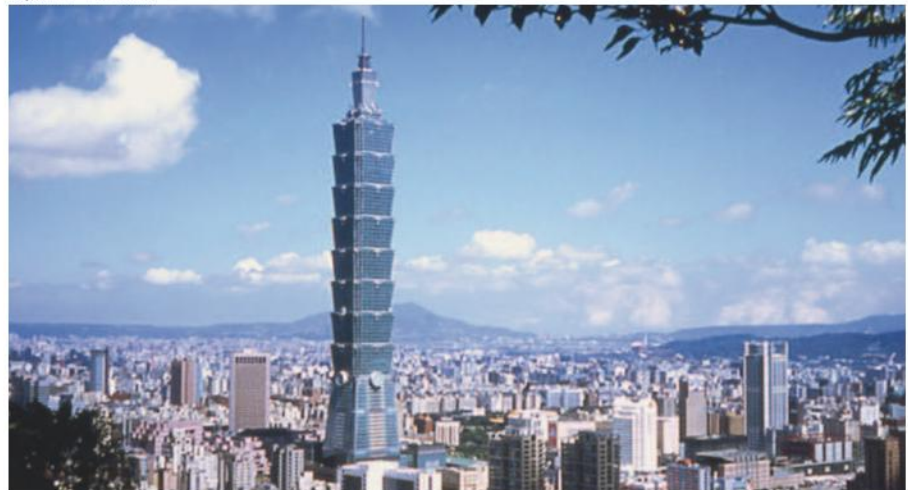
Taipei mit "101-Tower"

Fahrt südlich Richtung nach Tainan. Besuch des Chikan Tower, des Confucius Tempels sowie des Fort Anping. Anschliessend Weiterfahrt zum Foguangshan Kloster, dem grössten buddhistischen Kloster von ganz Taiwan. Übernachtung in einem Guest House des Klosters.