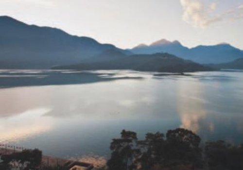
Sun Moon Lake